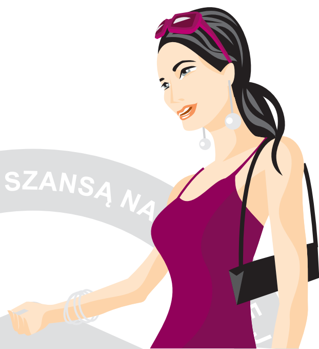
Nauczycielka biorąca udział w projekcie

Możliwość udziału w praktykach zawodowych dla nauczycieli była dla mnie niezwykle cennym doświadczeniem i okazją do zaktualizowania swojej wiedzy, którą mogę dzielić się z uczniami. Nabyte wiadomości i umiejętności praktyczne, zwłaszcza bezpośrednia obsługa gościa hotelowego czy organizacja przyjęć dla grup zorganizowanych, pozwoliły mi na lepsze, pełniejsze przygotowanie lekcji. Scenariusze prowadzonych przeze mnie zajęć z uczniami zostały wzbogacone o aktualną wiedzę i obejmują nowinki branżowe, które poznałam w trakcie pobytu w Kompleksie Wczasowo-Sanatoryjnym SANDRA SPA w Karpaczu.